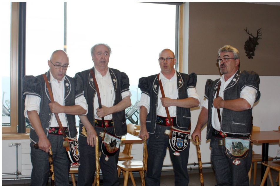
Des sons locaux pour accueillir les directeurs cantonaux de l'agriculture à Vounetz.